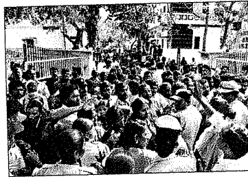
హాస్టల్ భవనం వద్ద ఆందోళన చేస్తున్న మృతుల బంధువులు, సంఘాల నాయకులు